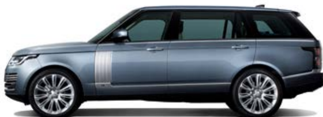
Empattement long (LWB) 3 120 mm