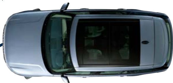
Longueur standard 5 000 mm (empattement long 5 200 mm)