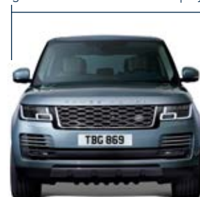
Voie avant : 1 693 mm

Largeur 2 073 mm rétroviseurs rabattus Largeur 2 220 mm rétroviseurs déployés