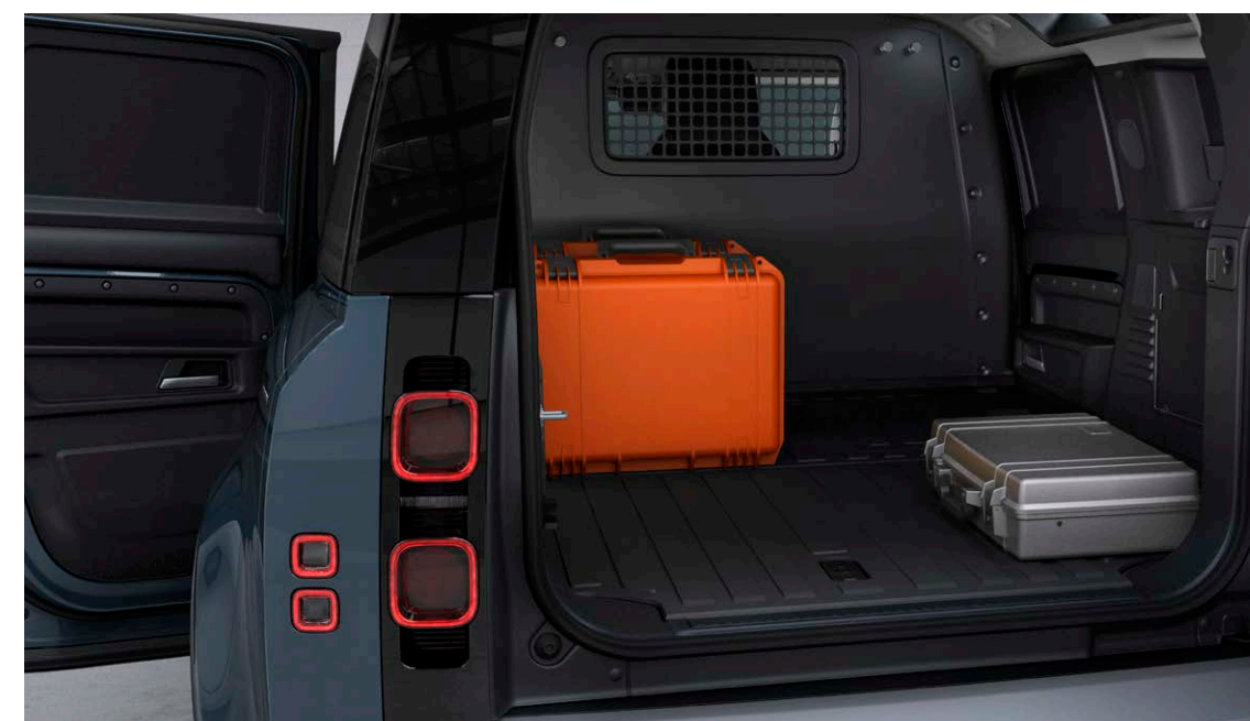
DEFENDER 110 HARD TOP