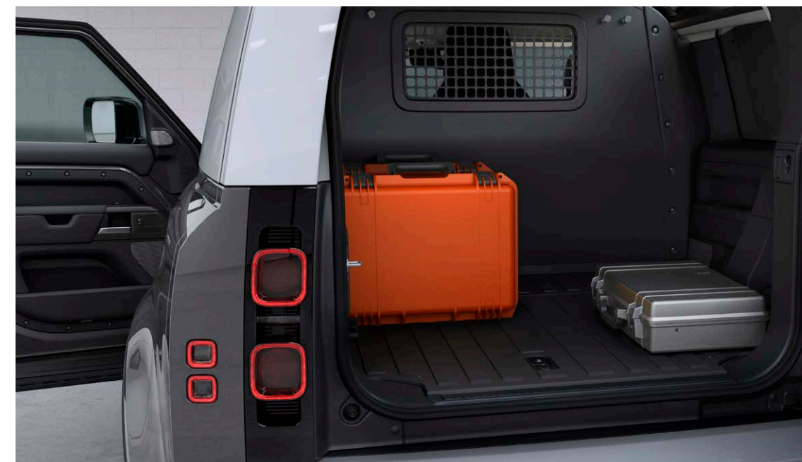
DEFENDER 90 HARD TOP